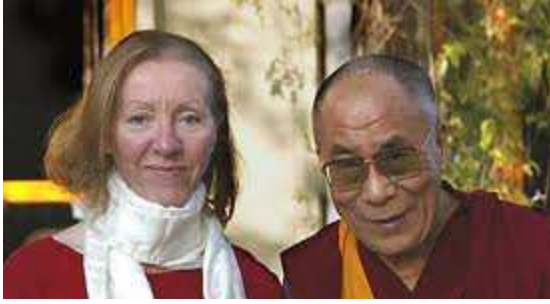
Sharon Begley avec le Dalai Lama lors de la réunion neuroplasticité à Dharamsala, en Inde, en 2004

A 14heures, Sharon Begley abordera les thèmes suivants : Étude de la neuroscience sur le cerveau de moines bouddhiste / Pratique spirituelle et potentiel de transformation de soi - sur le plan même du corps physique.